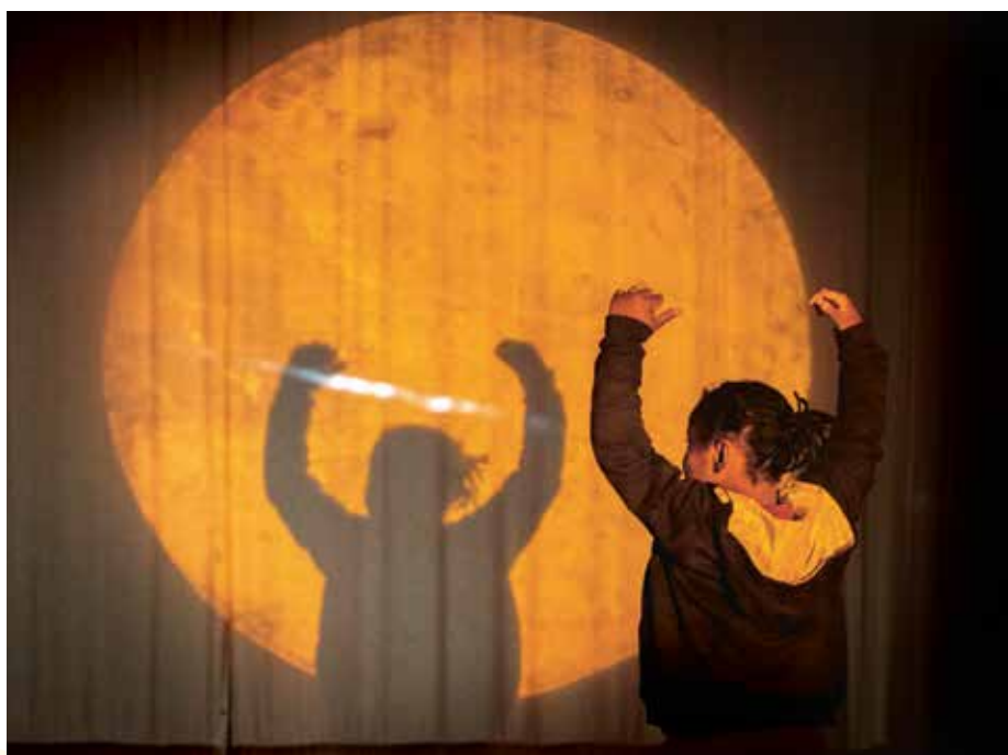
Sorties, ateliers... Les associations locales aussi s'emploient à favoriser l'éveil artistique et culturel des enfants et des adolescent-e-s.

Il y a la vie à l'école et la vie en dehors de l'école, pour laquelle la Ville et ses partenaires institutionnels et associatifs se mobilisent aussi. Sport, culture et loisirs, santé : zoom sur les ressources qui permettent aux enfants et aux adolescent-e-s de grandir, de trouver leur place et de s'épanouir. ● Olivia Moulin