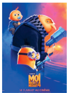
MOI, MOCHE ET MÉCHANT 4