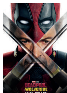
DEADPOOL VS WOLVERINE