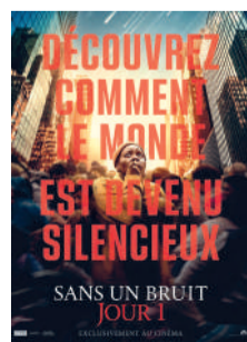
SANS UN BRUIT JOUR 1