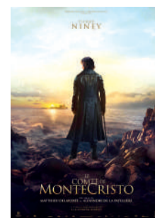
LE COMTE DE MONTE-CRISTO

Contact 01 49 92 61 95 • cinema@lacourneuve.fr