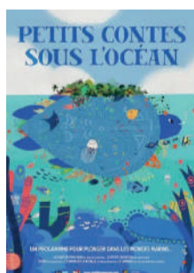
PETITS CONTES SOUS L'OcéAN

POUR LE CONFORT ET LA TRANQUILLITÉ DE TOUS, L'ENTRÉE DANS LA SALLE NE SERA PLUS AUTORISÉE 10 MINUTES APRÈS LE DÉBUT DE LA SÉANCE.