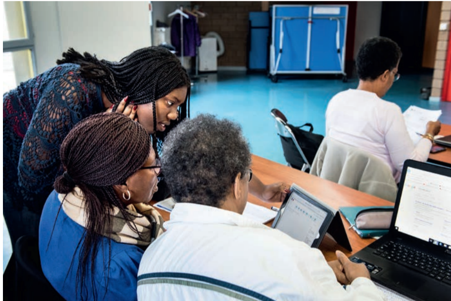
Les élèves du lycée Jacques-Brel ont assuré dans le rôle d'enseignantes.

À l'occasion de la semaine nationale des personnes âgées, les élèves de la filière ST2S du lycée Jacques-Brel ont animé des ateliers informatiques pour aider les seniors en situation d'exclusion numérique.