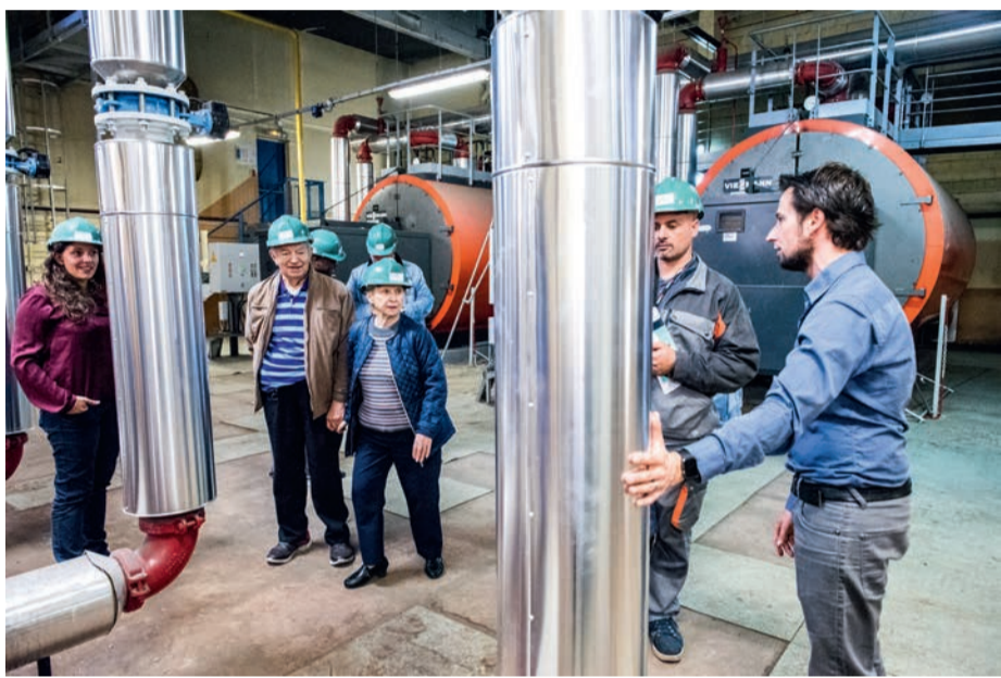
La chaufferie nord du réseau de chaleur de La Courneuve.

L'organisme qui produit le chauffage urbain de la ville, le Smirec, est un service public. Il associe les usagers au développement d'un réseau qui exploite la géothermie, une énergie renouvelable.