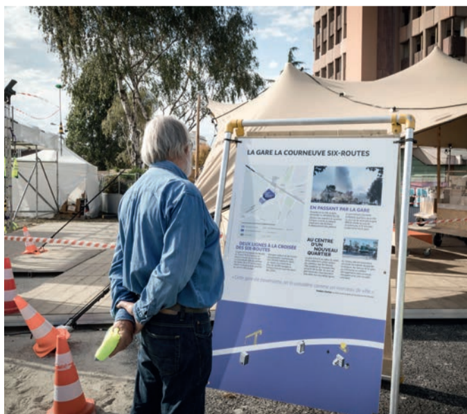
Plaine Commune informe sur l'avancée du chantier du Grand Paris Express.