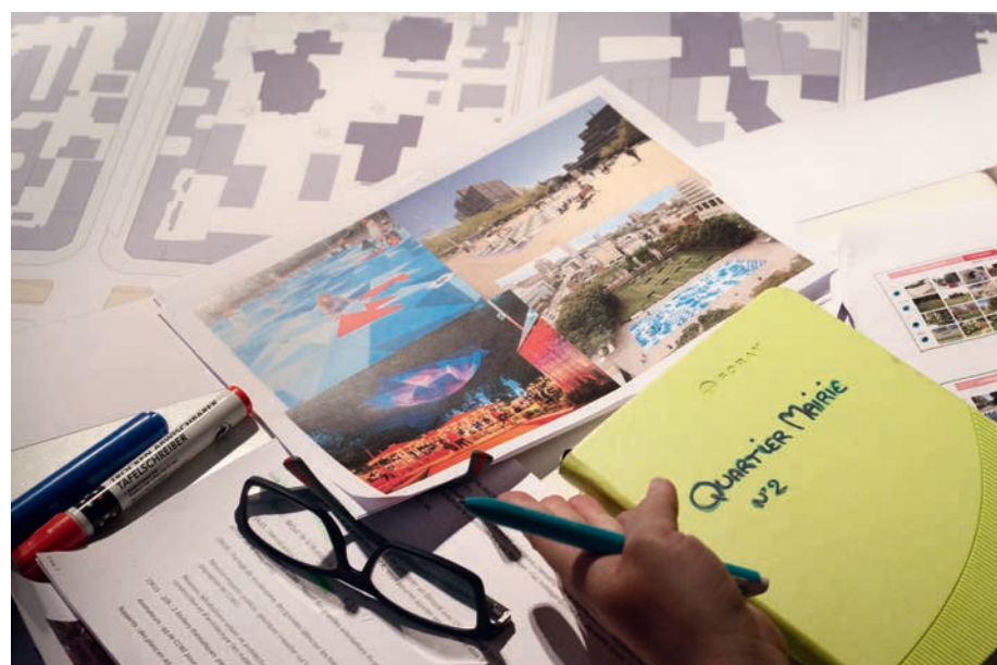
Le 29 mars, deuxième atelier pour préserver l'harmonie architecturale et valoriser le patrimoine dans le quartier de la mairie.

Après la question des espaces publics, les habitants ont réfléchi à l'architecture, au patrimoine et aux matériaux de leur futur centre-ville.