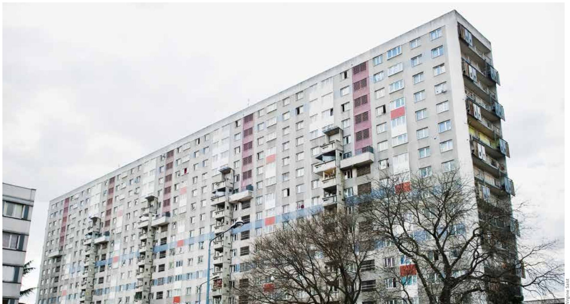
La barre Robespierre, comptant plus de 300 logements, doit être détruite avant mi-2020.