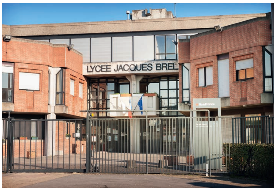
Les bons chiffres de Jacques-Brel soulignent le potentiel des lycéens courneuviens.

Le 21 mars dernier, Le Parisien dévoilait son classement des lycées 2017 en Seine-Saint-Denis. En tête de ce palmarès, on compte cinq lycées publics dont Jacques-Brel. Un bilan qui fait honneur à la ville.