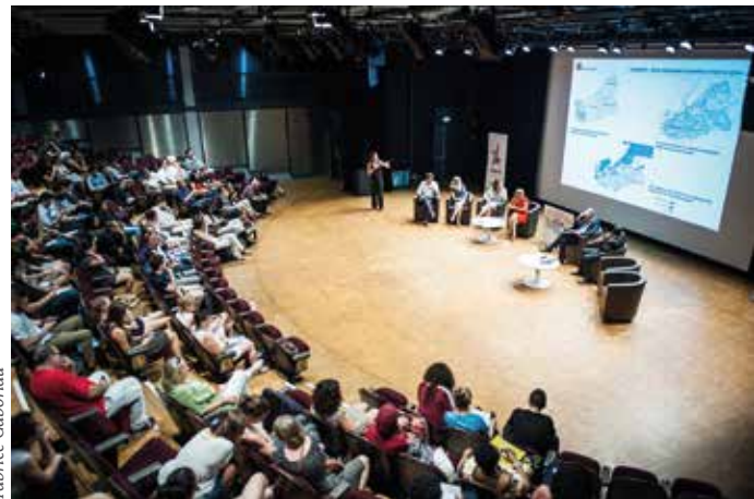
La rencontre s'est déroulée dans la Grande halle de La Villette.

Des collégiens de Seine-Saint-Denis étaient réunis le 8 juillet avec le Conseil des jeunes du 93, des étudiants de grandes écoles ainsi que le comité Génération 2024. Ils ont réfléchi à un projet olympique pensé pour le territoire.