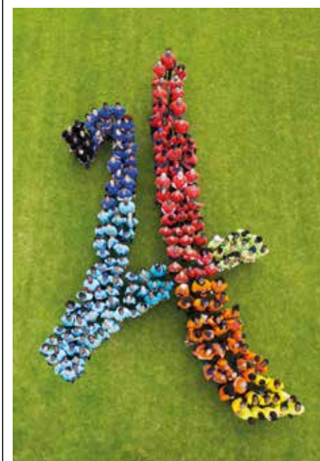
L'œil du platond

Le projet Paris 2024 devrait réduire les disparités territoriales, son impact positif se fait déjà sentir sur le plan humain comme en témoigne le dynamisme et l'enthousiasme de sa jeunesse, bien décidée à s'approprier les Jeux. Selon un sondage de mars 2017, 88% des jeunes de 15 à 25 ans soutiennent la candidature parisienne. ● Célia Houdremont