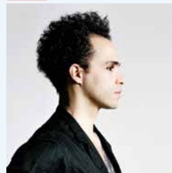
Frank Loniou / Agence VU

Auteur, compositeur, danseur, Nosfell est un artiste créatif qui manie aussi bien l'anglais que le français. Il sera précédé par La Chica Belleville, une artiste qui aime les sonorités électro-latines.