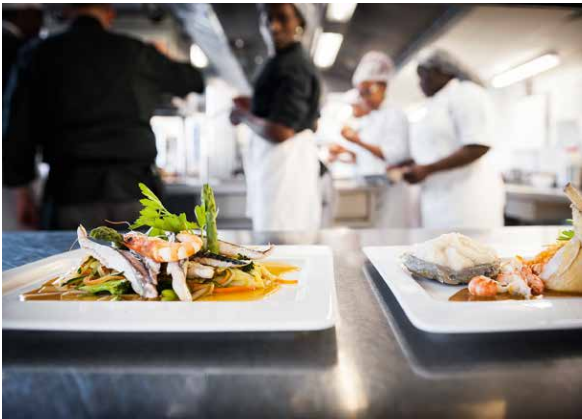
Les plats servis au lycée n'ont rien à envier à ceux des restaurants gastronomiques.

L'une des bonnes tables du coin se trouve au lycée hôtelier de Dugny. Dans son restaurant pédagogique, les élèves préparent et servent des plats gastronomiques à prix modérés.