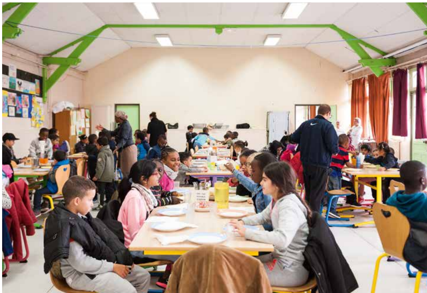
Les élèves sont accueillis dans une cantine provisoire.

Pour les élèves de l'école Joliot-Curie, la rentrée s'est faite le 11 septembre. Le maire ayant pris la décision de fermer l'établissement, à la suite de l'effondrement d'une partie du Petit Debussy, les 520 écoliers ont été répartis entre Paul-Doumer élémentaire et Charlie-Chaplin maternelle.