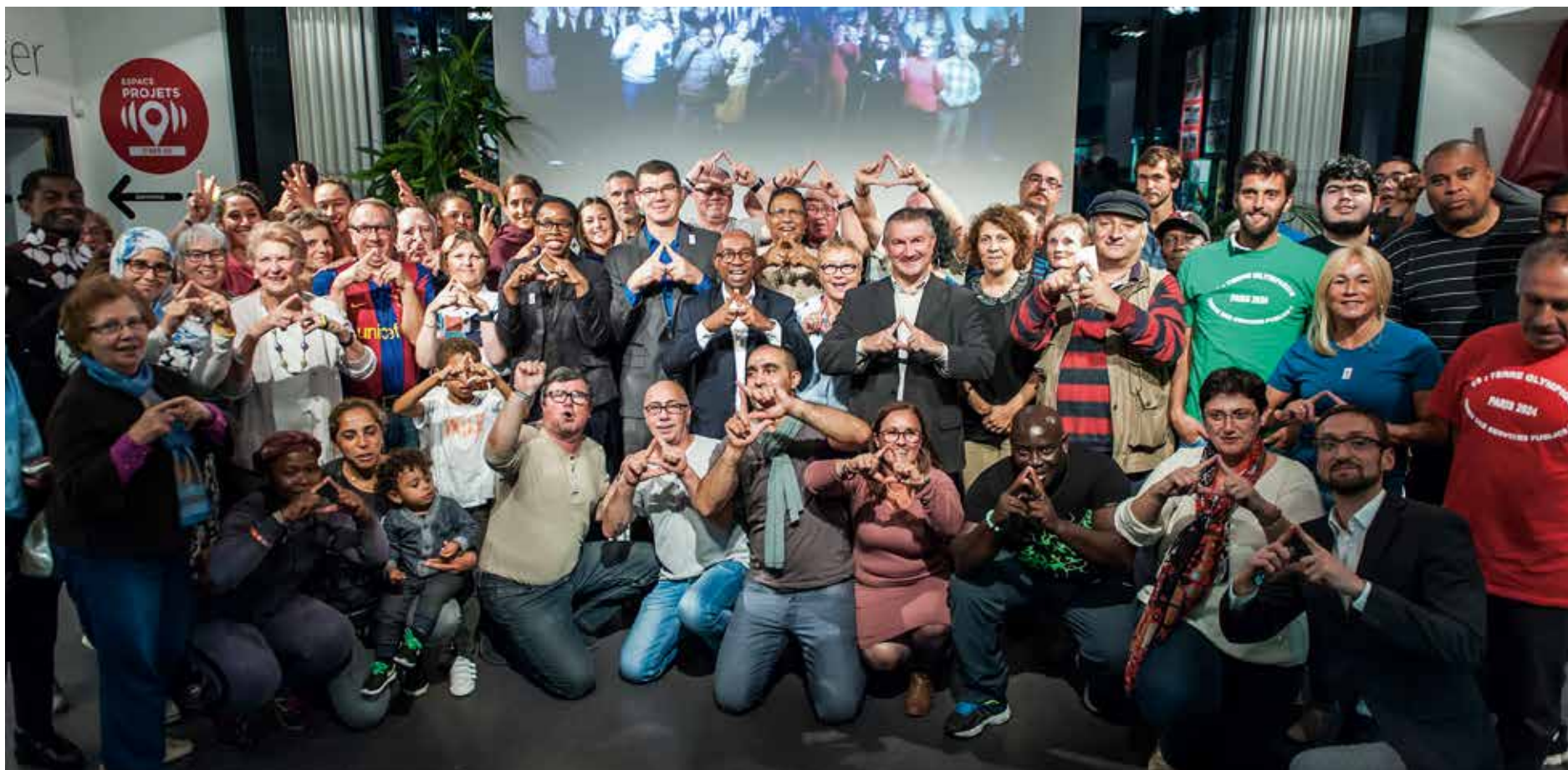
La Courneuve fête l'attribution à Paris des Jeux olympiques 2024.