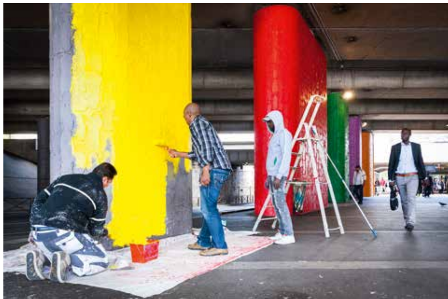
L'entrée de la gare prend un coup de neuf.

Fini le gris maussade! Les poteaux à l'entrée de la gare ferroviaire revêtent désormais des teintes vives. Un chantier mené par l'association d'insertion sociale et professionnelle Jade.