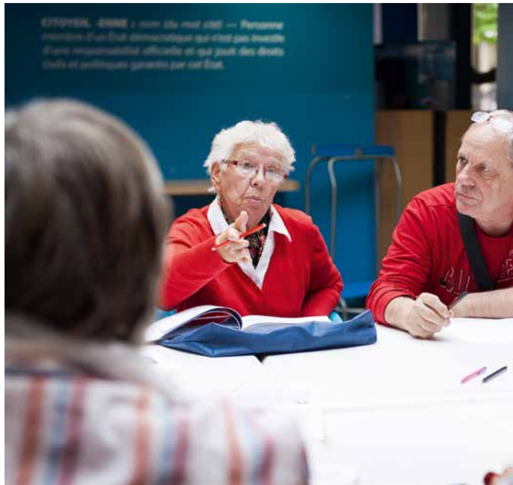
Les Sages travaillent à améliorer la vie quotidienne de tous les Courneuviens.

Infos : conseildessages@ville-la-courneuve.fr Tél. : 01 49 92 62 23