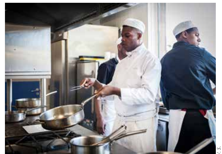
Les élèves cuisiniers s'activent aux fourneaux.

« J'ai choisi le service car j'aime le contact. J'ai apprécié les cours ici parce qu'on est très actifs, on ne passe pas son temps à faire des devoirs même si on a quand même des cours de maths, de français... En terminale, j'ai fait une alternance dans un Hippopotamus à Paris. L'alternance, c'est bien car on entre dans le monde des grands, on est payés, on a un statut et j'ai pu commencer à aider mes parents. À la fin de mon contrat, j'ai été embauchée en CDI comme serveuse. Pour l'instant, je travaille et je reprendrai peut-être des études plus tard. »