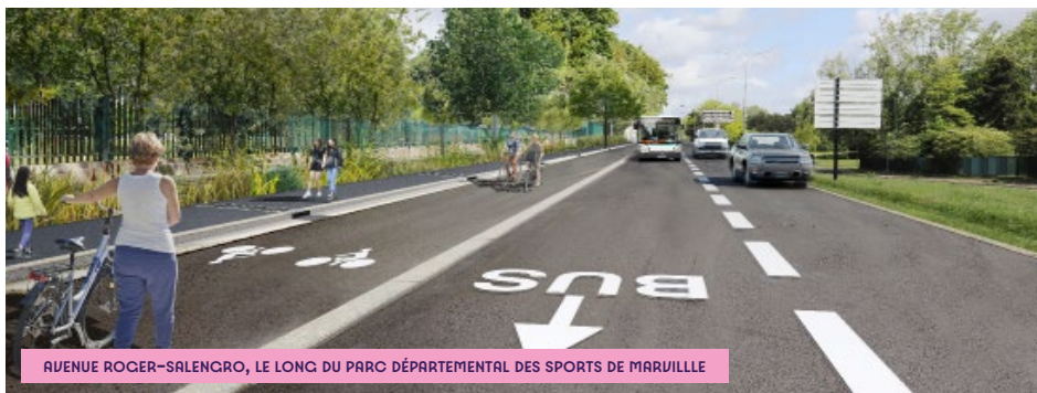
AVENUE ROGER-SALENGRO, LE LONG DU PARC DÉPARTEMENTAL DES SPORTS DE MARVILLE

Ce chantier favorise l'insertion et l'emploi local avec environ 12 000 heures de travail réservées notamment aux personnes éloignées de l'emploi, aux travailleurs handicapés, aux personnes issues des quartiers Politique de la ville ou aux seniors et jeunes en recherche d'emploi.