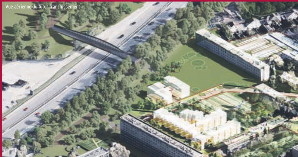
Vue aérienne du futur franchissement

© Marc Mimram Architecture Ingénierie /Igreç Ingénierie /Michel Desvignes Paysagiste