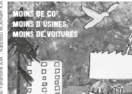
© Fahardine A.M., Nadjibou M., Arham K.H.

La Maison de la citoyenneté James-Marson met à l'honneur le projet d'un groupe d'élèves allophones, et de leur enseignante, du collège Georges-POLITZER. Aux côtés de l'association Ariana MIX'ART et du collectif de graffiti artistes #Loveplanet, ces collégien-n-es éco-responsables ont produit des affiches de street art sur l'urgence climatique exposées à la MdC James-Marson. Un projet exemplaire mêlant apprentissage du français et transmission des valeurs éco-citoyennes qui fera l'objet de regards croisés